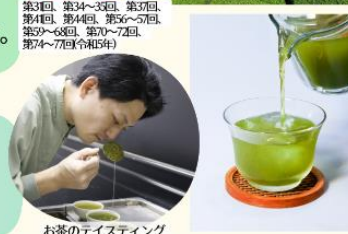
お茶のテイステイング

第31回、第34~35回、第37回、第41回、第44回、第45~46回、第47~48回、第49~50回、第51~52回、第54~55回(計55年)