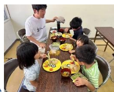
7/19(水)「産直小麦のホットケーキミックス寄贈」

・NPO法人POPOLOが島田市より受託した事業「しまだ夏休み子ども食糧支援事業」へ産直小麦のホットケーキミックス460個を寄贈しました。